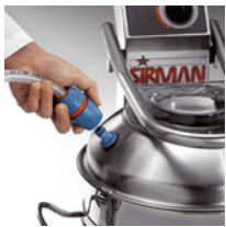
Fast connection/remove of water entry