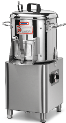
Sirman Картофелечистки , model PPJ 6 SC :

Sirman Spa Viale dell'Industria 9/11 35010 PIEVE DI CURTAROLO (PD), Italy Tel./Fax. +39 049 9698666 / +39 049 9698688 email: info@sirman.com