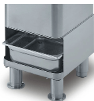
Optional trestle with sieve