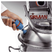
Fast connection/remove of water entry