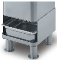
Optional trestle with sieve