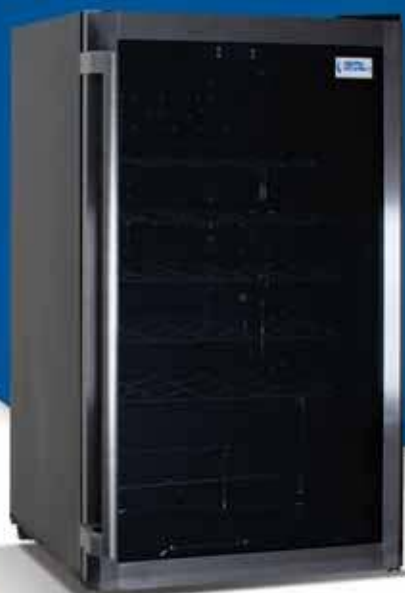
CRW 100 B