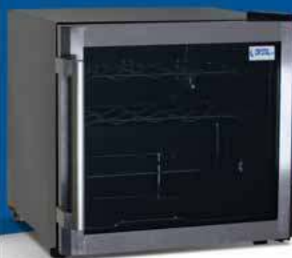
CRW 50 B