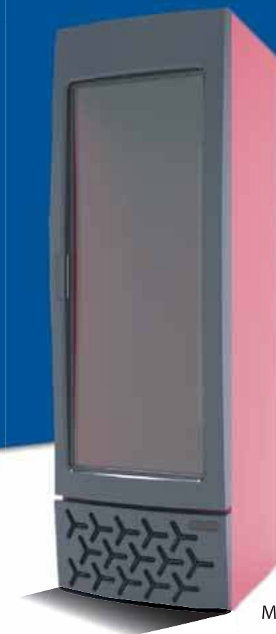
MIRA (CRF 300)