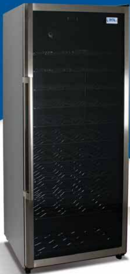
CRW 350 B